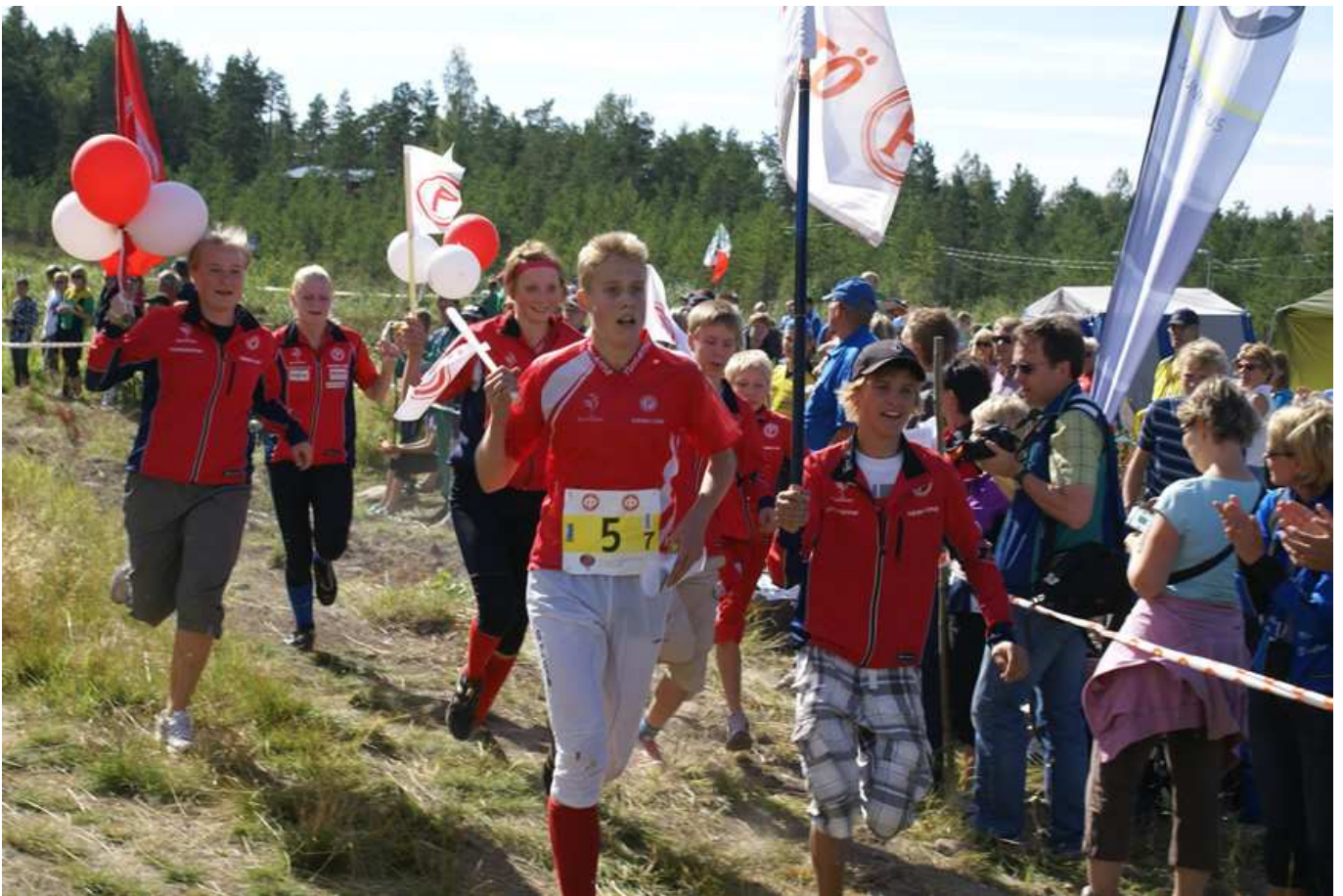
Pyrintö on Nuorten Jukolan menestynein seura. Vaasassa punanutut voittivat viidennen kerran. Ensi vuonna Pyrintö ei voita - TP järjestää sen ;)